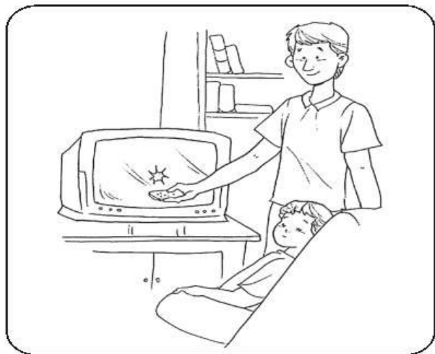
Si nos quedamos dormidos apagar la TV.