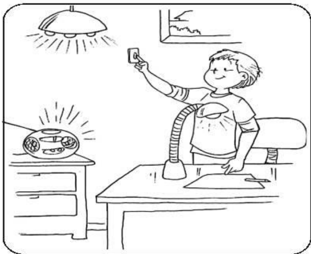
Apagando luces que no se usan.